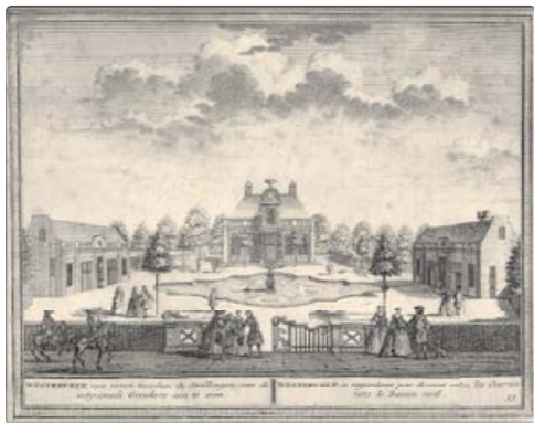
Prent uit circa 1730 van de voorzijde van de Hofstede Westerveld in Driehuis.

jaartallen van bijzetting te kijken, ziet 125 jaar funeraire historie aan zich voorbij trekken.