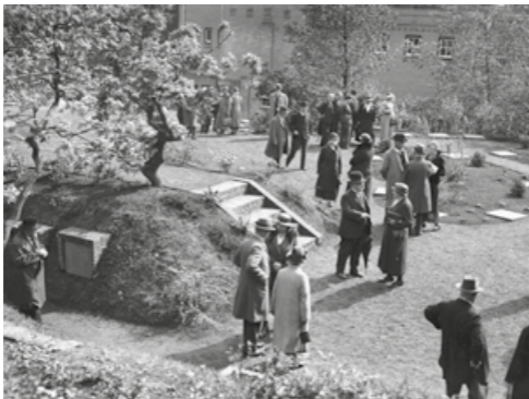
De opening van de umentuin op 27 mei 1933.