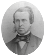
Cornelis Fock, de minister die in 1869 de Begrafeniswet door de Tweede Kamer kreeg.

In 1874 werd in Den Haag de Vereniging tot Invoering der Lijkverbranding in Nederland opgericht. Zes personen waren hiervoor verantwoordelijk: M.E.A.G. Campbell , bibliothecaris