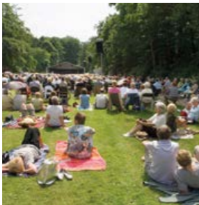
Het Concerto in Memoriam biedt mensen de mogelijkheid om samen te herdenken.

door voor de Allerzienviering het gedenkpark 's avonds open te stellen. Iedereen die een dierbare overledene wilde gedenken, was welkom, of die nu op Westerveld is begraven of bijgezet, of elders. De KRO televisie heeft er een live-registratie van gemaakt en die rechtstreeks uitgezonden in het kader van het programma Ode aan de Doden (zie ook hoofdstuk 7).