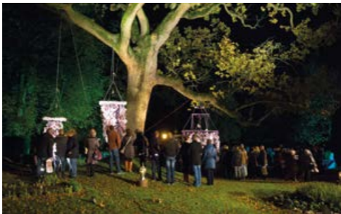
De gedenkboom met foto's van dierbaren, tijdens Allerzielen in 2012.

door voor de Allerzienviering het gedenkpark 's avonds open te stellen. Iedereen die een dierbare overledene wilde gedenken, was welkom, of die nu op Westerveld is begraven of bijgezet, of elders. De KRO televisie heeft er een live-registratie van gemaakt en die rechtstreeks uitgezonden in het kader van het programma Ode aan de Doden (zie ook hoofdstuk 7).