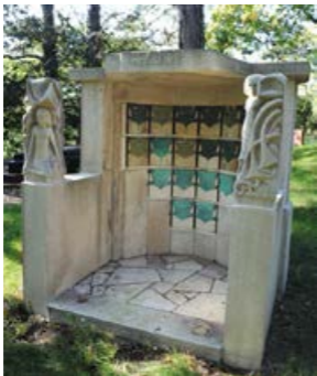
Urnenmonument van de beeldhouwer Hildo Krop, bekend van bruggen en gebouwen in Amsterdam. Voor de familie Van Saher verwerkte hij twee figuren die droefheid en vreugde symboliseren.