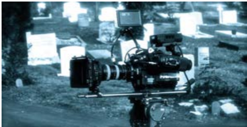
Westerveld is vaak het decor voor (televisie)opnamen.

Iedereen die Westerveld bezoekt is steeds weer onder indruk van de monumentale schoonheid. Ook regisseurs, programmamakers en zogeheten locatiescouts kunnen Westerveld maar moeilijk weerstaan vanwege 'het unieke monumentale karakter, de fraaie ligging en de haast on-Nederlandse uitstraling'. En het is waar, Westerveld is monumentaal, magistraal en fenomenaal. En voegt zeggingskracht, sfeer of kwaliteit toe aan bewegende beelden, van welke soort ook.