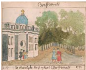
Teekeningen van de buitenplaats Westerveld uit 1732. De onderste geeft waarschijnlijk de achterzijde van Westerveld weer of een fraaie tuinkapel bij één van de lindentanen.