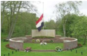
In 1948 werd het oorlogsmonument in het gedenkpark opgericht. Hier vindt elk jaar op 4 mei een kranslegging plaats.