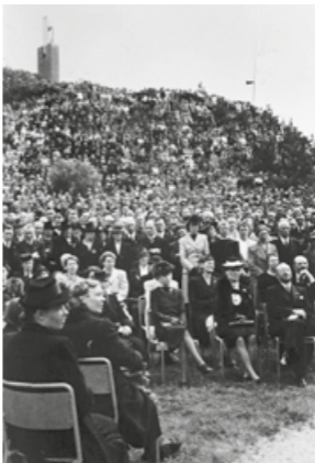
De eerste dodenherdenking op Westerveld in 1946.

Op Allerzielen (2 november) is het vaak drukker dan normaal op Westerveld. Allerzielen is een van oorsprong katholieke traditie waarbij mensen hun dierbare overledenen extra eren, bijvoorbeeld door bezoek aan het graf. In 2012 startte Westerveld mogelijk een nieuwe traditie