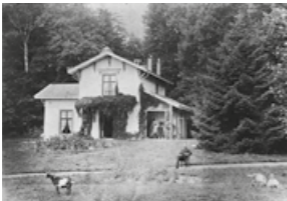
Huize Westerveld in 1910; de villa uit 1866 is de oudste villa in de gemeente Velsen en werd in 1993 rijksmonument.

H et zijn de besturen van zowel de Begraafplaats Westerveld als van de Koninklijke Vereniging voor Facultatieve Crematie geweest die de eer toekomt van Westerveld een (openlucht)museum voor architectuur te hebben gemaakt. Zij waren het die vooraanstaande architecten uitnodigden om het terrein en de 'opstallen' voor Westerveld – op Villa Westerveld na – te ontwerpen en uit te voeren.