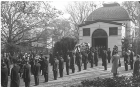
Een begrafenis in 1937 vanuit de Westerveld aula.