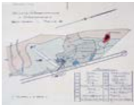
Situatietekening van de begraafplaats.